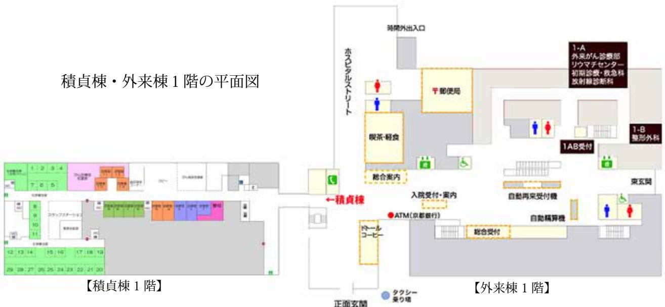
【積貞棟 1 階】