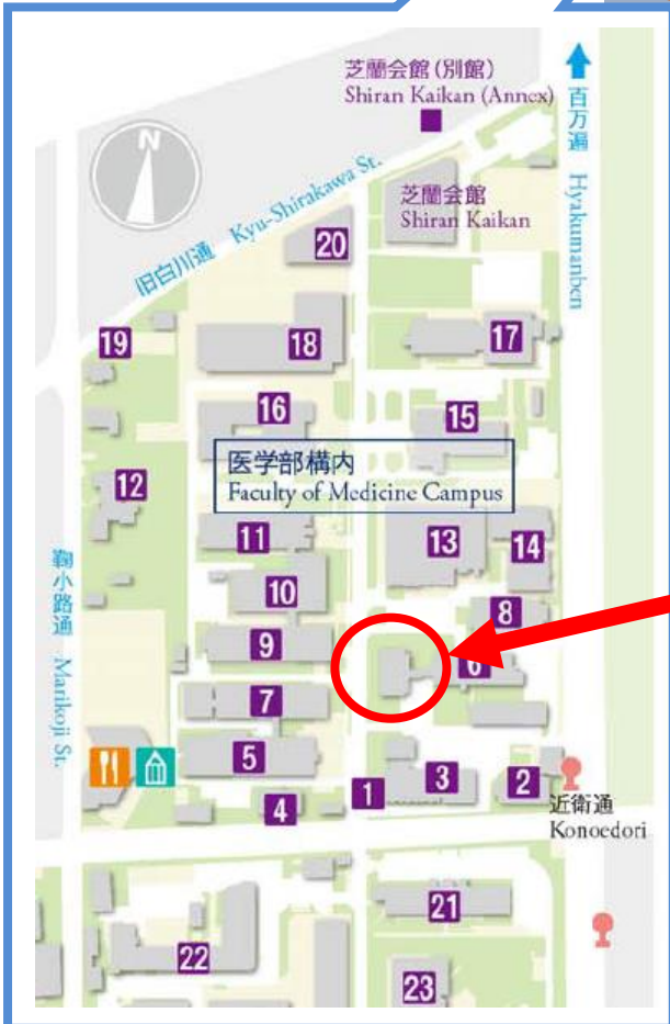
京都大学医学部記念講堂