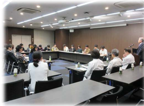
2月14日 コース別研修発表