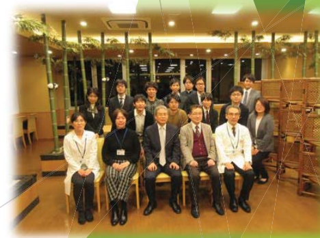
2月13日 情報交換・懇談会